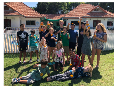
I onsdags lärde Sunum oss hur man gör Pomalai (blomsterkransar) som alla fick ta med sig hem.

Fredag - har vi alltid en extra lång poolrast