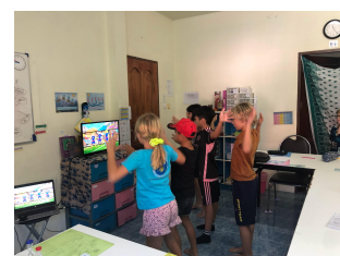
Let's dance som lite avbrott i allt arbete :)