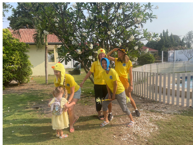
Glad påsk önskar vi på Sanuk!